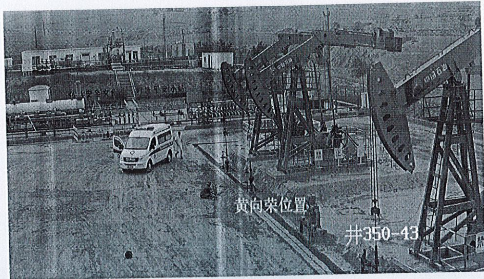
图 2: 黄**具体位置示意图